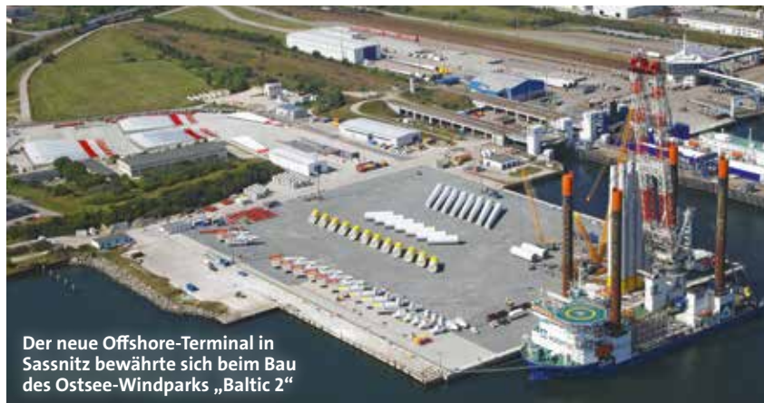
Der neue Offshore-Terminal in Sassnitz bewährte sich beim Bau des Ostsee-Windparks „Baltic 2“

Zusätzlich verschärft wurde die Krise im Fährgeschäft an