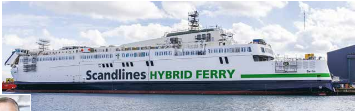
Wird in Rostock erwartet: die neue Fähre „Berlin“. Hier noch in der Ausrüstung bei Fayard A/S in Dänemark

und das Unternehmen geht nunmehr davon aus, dass die „Berlin“ nicht vor Ende 2015 einsatzklar sein wird. Für die „Copenhagen“ wird gleich gar keine Zielmarke mehr genannt, sie komme „einige Monate später“, heißt es bei Scandlines. Beim Umbau der ursprünglich auf der Volkswerft Stralsund gefertigten Fähren, mit dem die dänische Werft Fayard A/S in Munkelbø bei Odense beauftragt worden ist, seien zahlreiche technische Probleme aufgetreten, die eine Auslieferung weiter verzögerten. Die Modifizierung der jeweils 169,5 Meter langen und 24,8 Meter breiten Schwesterschiffe war erforderlich geworden, nachdem sie auf der Volkswerft um je