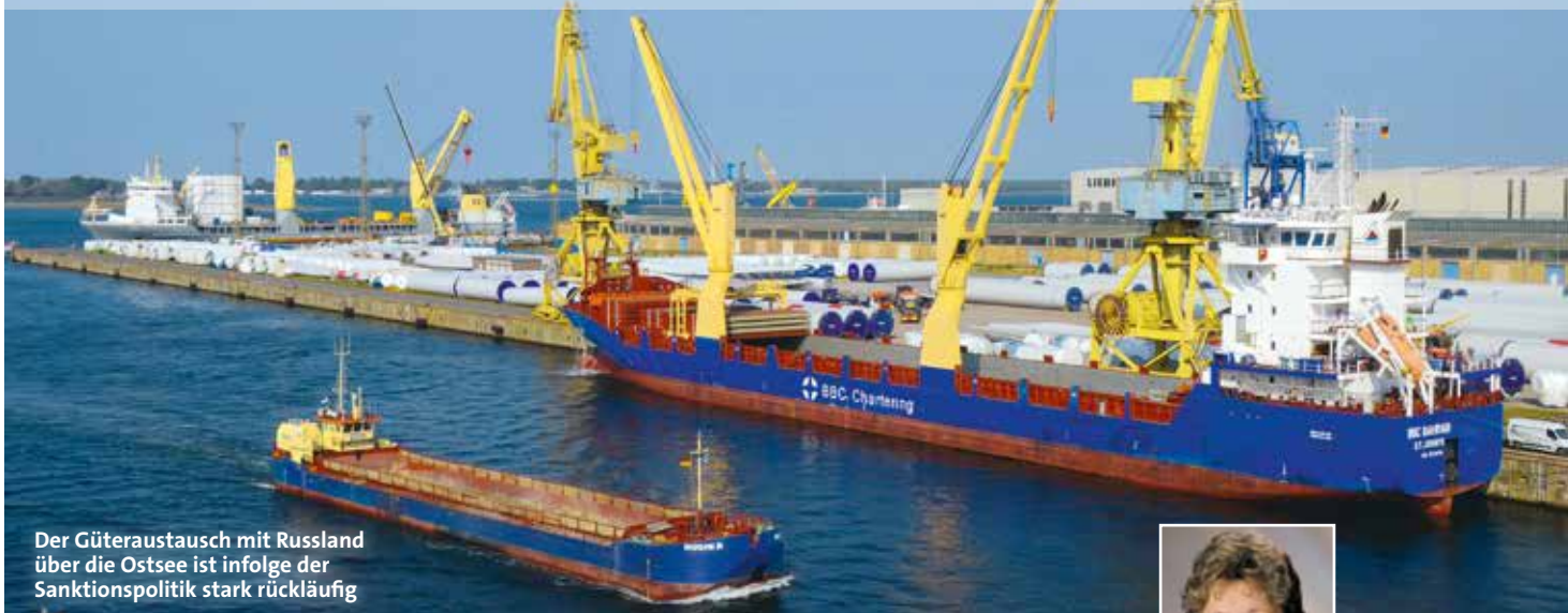
Der Gütertausch mit Russland über die Ostsee ist infolge der Sanktionspolitik stark rückläufig