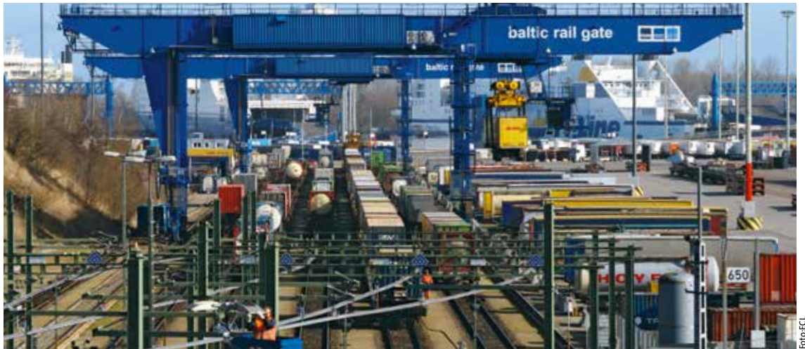
European Cargo Logistics wickelt die „Baden Shuttle“-Blockzüge in Travemünde über den Terminal Baltic Rail Gate ab